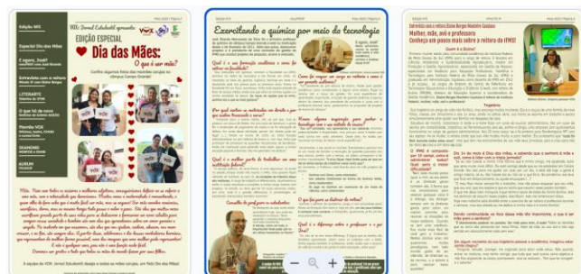
Figura 4. páginas diagramadas do jornal

no decorrer das atividades, algumas colunas seguem o próximo passo que é a diagramação, enquanto outros textos passam pela última revisão. A seguir algumas imagens com as páginas do jornal na etapa da diagramação: