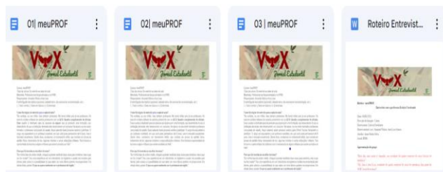
Figura 3. Processo de escrita e revisão do VOX

Partindo dessa visão geral do jornal, as atividades como a entrevista, por exemplo, são iniciadas com a escrita do roteiro e o agendamento do horário com o entrevistado. Na sequência, a entrevista é feita e o texto ganha o formato do gênero discursivo que será revisado pela professora orientadora, enviados novamente para o entrevistado e, por último é organizado na pasta do drive para a diagramação, como é possível observar na: