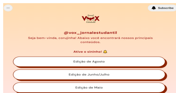
Figura 5. VOX na plataforma do linktree on-line

Nessa sequência, após a diagramação final, a edição do jornal vai em formato PDF para a plataforma on-line para o acesso de toda a comunidade interna e externa. Além disso, é importante citar que o VOX tem seu espaço nas mídias sociais em interação constante com participantes. Segue a imagem do aplicativo com todas as edições disponíveis para leitura: