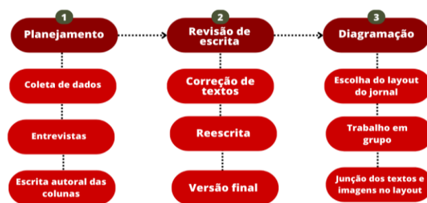
Figura 1. Fluxograma do desenvolvimento das etapas

Para o desenvolvimento da escrita do jornal estudantil, foram desenvolvidas três etapas em que consiste o planejamento, revisão da escrita e diagramação como segue na figura: