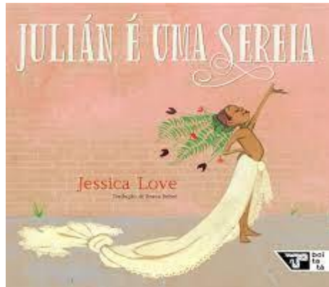
Figura 2 - Livro Julian é uma sereia de Jéssica Love