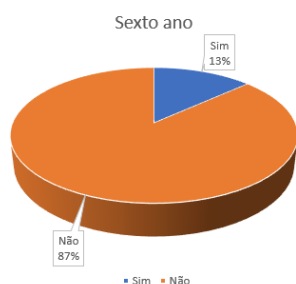
Gráfico 1: questão 3 do questionário.

Sobre os exemplos que foram citados, ambos merecem atenção, pois ‘o universo’, embora seja sabido que inúmeros processos químicos ocorrem por lá, não é uma situação que se pode observar em nosso cotidiano terráqueo. O segundo exemplo, por sua vez, não é um fenômeno químico e sim um fenômeno físico, pois a composição da água não é alterada no processo de evaporação.