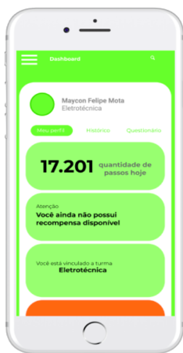
Figura 2. Tela Inicial do aplicativo para dispositivos móveis onde conterà um resumo de suas informações.