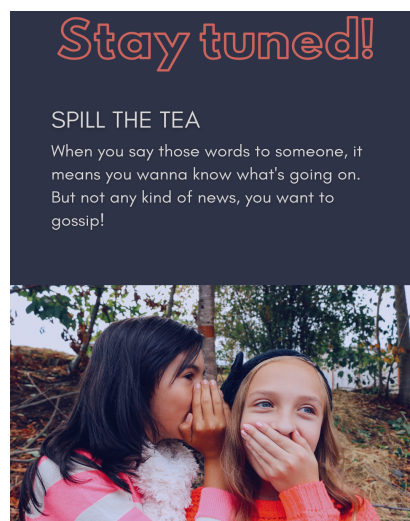
Figura 1. Criação de conteúdo nos Stories do Instagram a partir da expressão 'Spill the Tea', discutida no encontro Let's Bora de 12.05.2021.

Os encontros de conversação Let's Bora aconteciam semanalmente com a presença dos estudantes voluntários da equipe de trabalho ( staff ) e da comunidade interna do campus Campo Grande do Instituto Federal de Mato Grosso do Sul, em sua maioria, estudantes do ensino médio integrado ao técnico. O planejamento ocorria durante as reuniões de equipe, respeitando um cronograma previamente estabelecido no qual cada integrante se responsabilizava por uma atribuição de modo que cada um tivesse a oportunidade de desenvolvê-la em momentos diferentes. As atribuições incluíam: direção do encontro Let's Bora, divulgação em redes sociais, anotação de assuntos levantados durante as conversações, criação de conteúdo a partir de tais anotações, aplicação de questionário com feedback dos encontros.