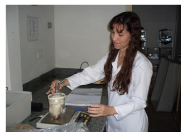
Figura 2 - Imagem do protótipo feito com garrafa PET, sendo utilizado por uma pesquisadora em um laboratório.