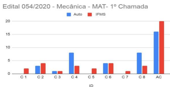
Figura 1. Perfil étnico racial do curso técnico integrado de mecânica 1º Chamada Edital 054/2020.